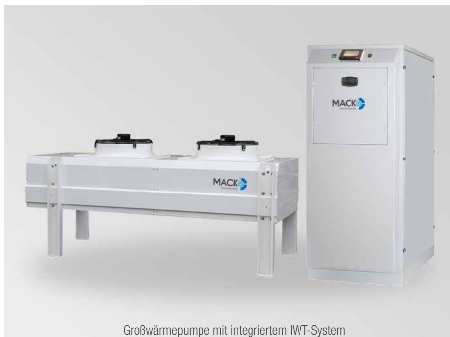
Großwärmepumpe mit integriertem IWT-System

Großwärmepumpen erreichen problemlos Temperaturen von 60°C. Dadurch eignen sie sich hervorragend für die energetische Gebäudesanierung sowie für eine hygienische und energiesparende Trinkwassererzeugung. Im Sommer können Sie unsere Großwärmepumpen dagegen übrigens auch zur Kühlung und Gebäudeklimatisierung nutzen. Die bei dem Prozess entzogene Wärme lässt sich sogar einfach wieder zur Beheizung anderer Gebäudebereiche nutzen.