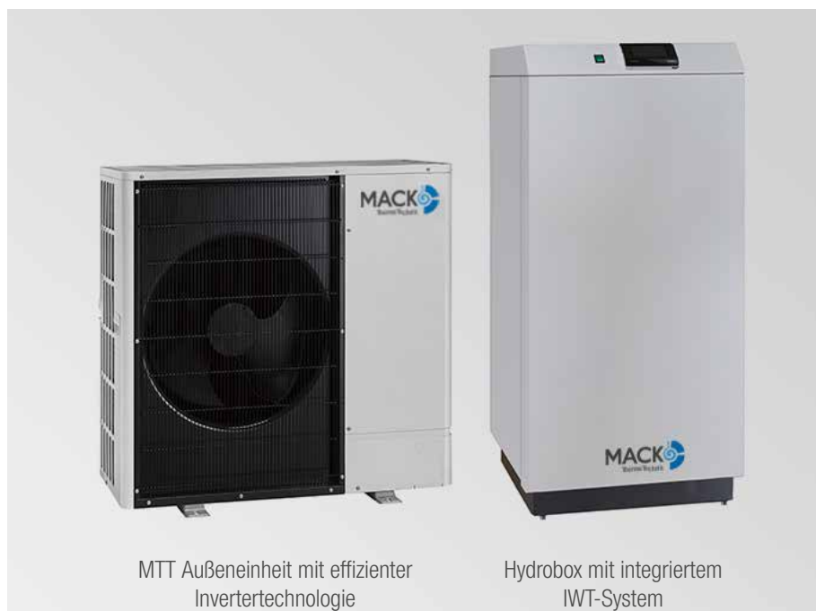
MTT Außeneinheit mit effizienter Invertertechnologie

Die Luft-Wasser-Wärmepumpe gibt es in Split-Ausführung mit einer geräuscharmen Inverter-Außeneinheit im Leistungsbereich von 7 kW bis 12 kW. Die Aereco MTT LWWP ME ist übrigens besonders kostengünstig und eignet sich für den Neubau sowie für die Modernisierung bestehender Anlagen.