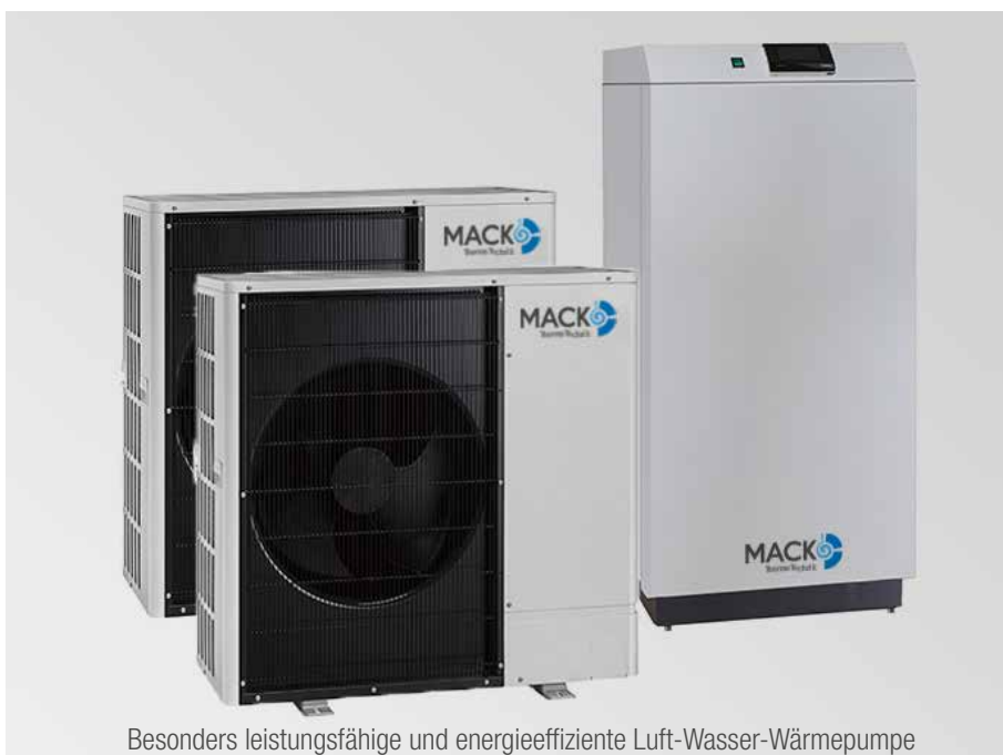
Besonders leistungsfähige und energieeffiziente Luft-Wasser-Wärmepumpe

Nicht zuletzt zeichnen sich die beiden Außeneinheiten der neuesten Generation neben einem modernen Design durch geringe Schallemissionen aus. Damit sind sie auch im Nachtbetrieb flüsterleise.